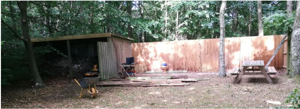
Billede 1 – viser skuret til venstre