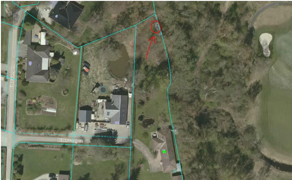
Kort 1 – viser skurets placering markeret med rød cirkel

Ejendommen er placeret i et område som er udlagt til boligområde i kommuneplanen ved rammen LU.B.16.